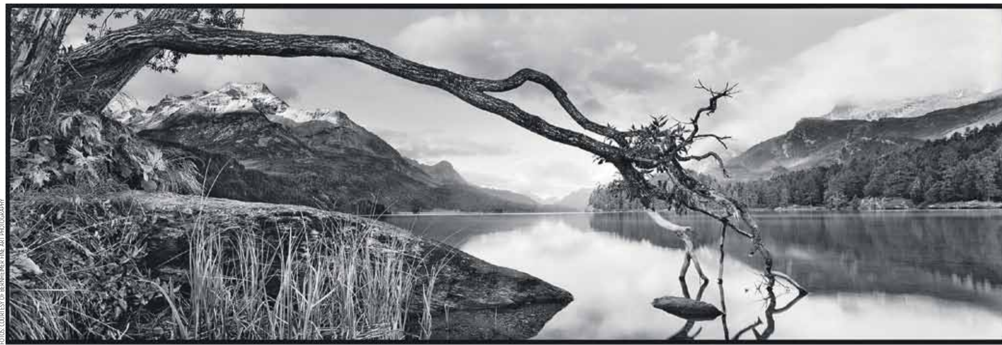
◀ Christopher Thomas: «Silsersee II», 2013.