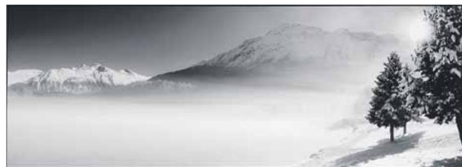
▲ Christopher Thomas: «St. Moritzersee IV», 2015.

Die Arbeiten sind in den Formaten 27 × 80 cm, 50 × 120 cm und 56,5 × 160 cm erhältlich. Die Preise liegen zwischen 2700 und 10 500 Euro, je nach Auflage. (ba)