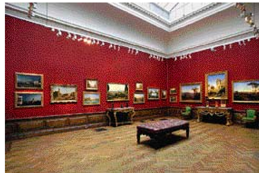
Abb. rechts: Blick in die Räume von Colnaghi mit Ausstellung „In Italian Light“; © P&D Colnaghi & Co, Ltd.

Denn „niemand sammelt mehr alte Meister, wie man früher Baseball Cards sammelte“.